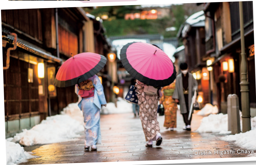
Distrik Higashi Chaya

Identitas Ishikawa dibentuk oleh Klan Maeda, yang menggunakan kekayaan mereka untuk mengembangkan budaya, bukan kekuatan militer. Warisan ini masih terasa hingga kini melalui berkembangnya seni tradisional, manisan wagashi, serta lanskap kota bersejarah yang tetap menjadi bagian penting dari kehidupan masyarakat setempat.