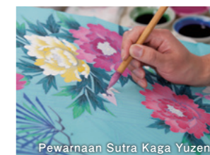
Pewarnaan Sutra Kaga Yuzen

Sejak era samurai, para pengrajin di Ishikawa telah menjaga tradisi seperti daun emas, porselen Kutani, sutra Kaga Yuzen, serta kerajinan pernis Wajima dan Yamanaka. Seni tradisional seperti Noh juga tetap menjadi bagian penting dalam budaya lokal.