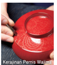
Kerajinan Pernis Wajima