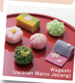
Wagashi (Jajanan Manis Jepang)

Ishikawa dikenal dengan kulinernya yang istimewa, mulai dari Kaga Kaiseki dengan seafood segar dan sayuran lokal yang disajikan dalam peralatan makan tradisional, hingga sake lokal, matcha, dan manisan wagashi.