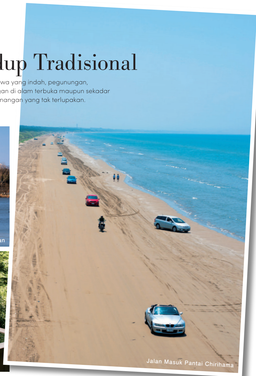
Jalan Masuk Pantai Chirihama