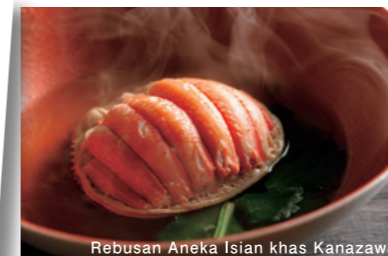
Rebusan Aneka Isian khas Kanazawa