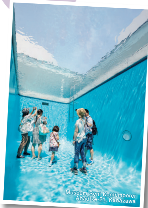
Museum Seni Kontemporer Abad ke-21, Kanazawa

Prefektur Ishikawa memadukan kekayaan tradisi budaya akan seni modern, kuliner mewah, dan akses Shinkansen yang praktis.