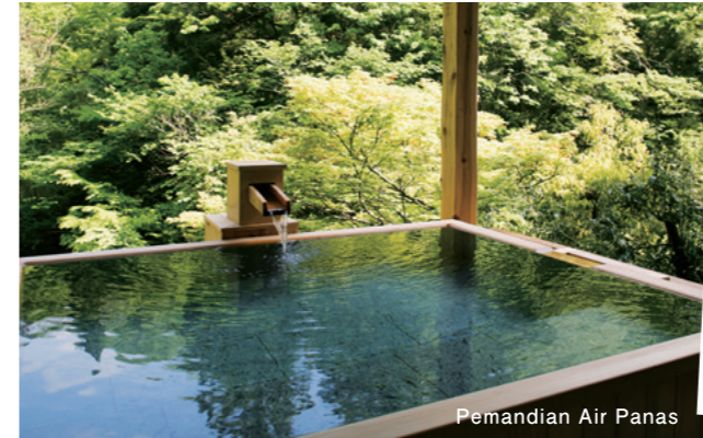
Pemandian Air Panas